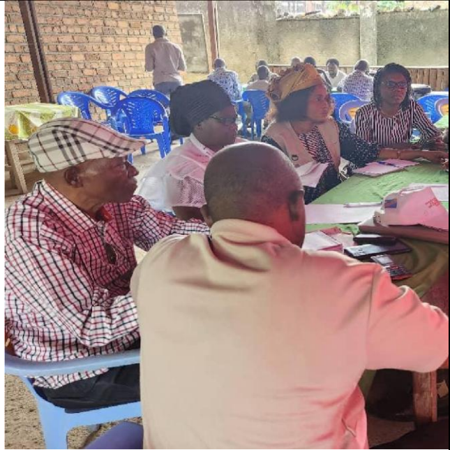
La spécialiste en VBG entrain de conduire le focus de group de consultation avec l'équipe de l'équipe du Gouvernement provincial du Maniema