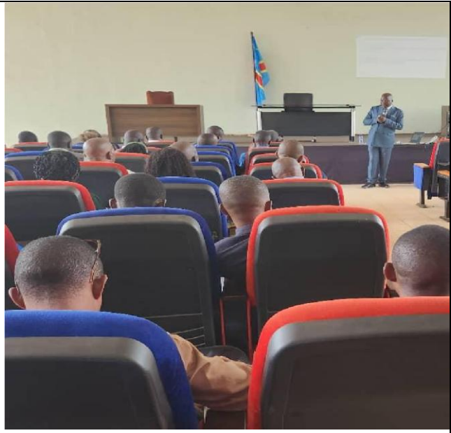
Atelier d'information des parties prenantes sur le projet ENCORE à Mbandaka