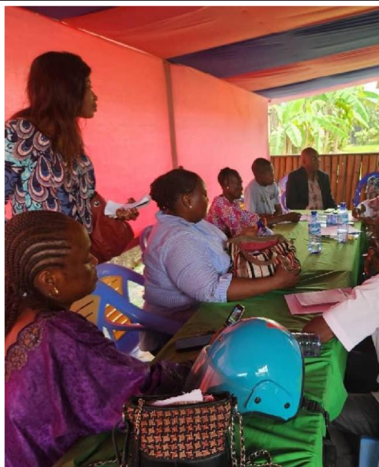
Focus groupe avec les femmes leaders de la Province du Maniema