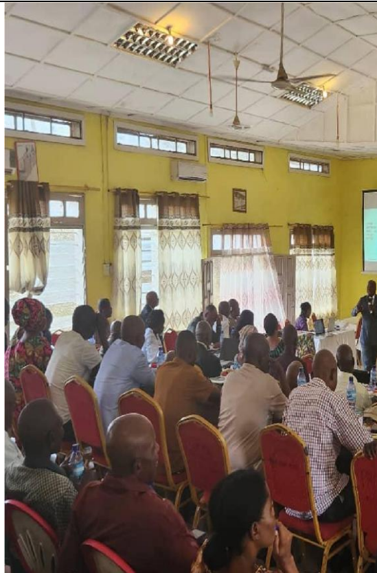
Le spécialiste en décentralisation financière /UCPENCORE entrain d'expliquer aux parties prenantes de la province du Maniema les reformes financière en RDC et le projet ENCORE