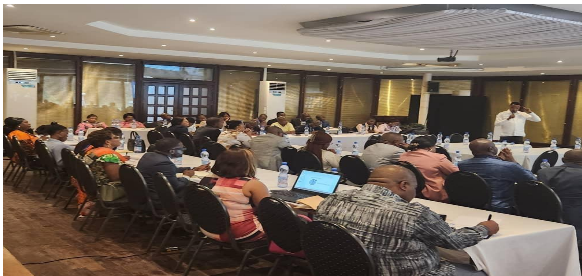
Atelier d'information et sensibilisation des parties prenantes sur le projet ENCORE