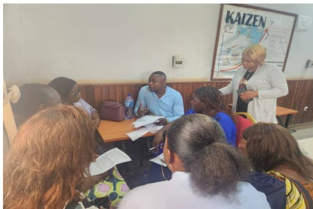
Focus group des leaders des femmes des services étatiques bénéficiaires à Kinshasa