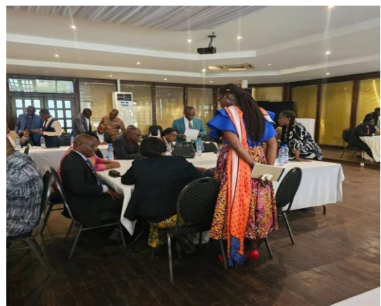
Focus group avec les représentants hommes des service étatiques à Kinshasa